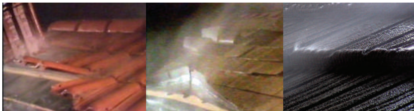
Țigle ceramice / beton