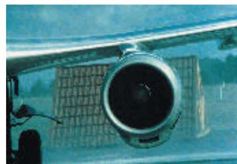
Acoperișul Gerard rezistă cu succes la testul de furtună și vânt.

aer a fost introdusă apă. S-a aplicat apă sub toate unghiurile (50mm/sec/mp de acoperiș - echivalentul a 180mm de ploaie/oră), dar nu s-a constatat nicio infiltrație.